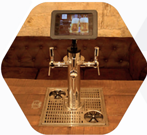
TABLE À BIÈRE